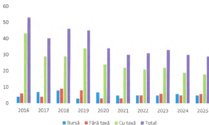
Graficul 1 – Evoluția numărului de doctoranzi, din perioada 2016-2025, pe tip de loc

Din totalul de 29 de doctoranzi înmatriculați în anul universitar 2025 - 2026, 5 doctoranzi au fost înmatriculați la forma de învățământ cu frecvență redusă, fără taxă, alți 5 doctoranzi la forma de învățământ cu bursă iar un doctorand a fost admis pe un loc fără taxă la forma de învățământ cu frecvență redusă, în calitate de român de pretutindeni. Restul de 18 doctoranzi au fost înmatriculați la forma de învățământ cu taxă.